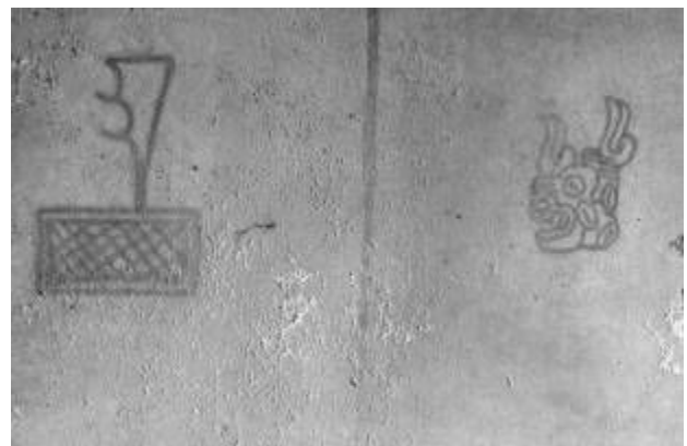
図 3 象形文字