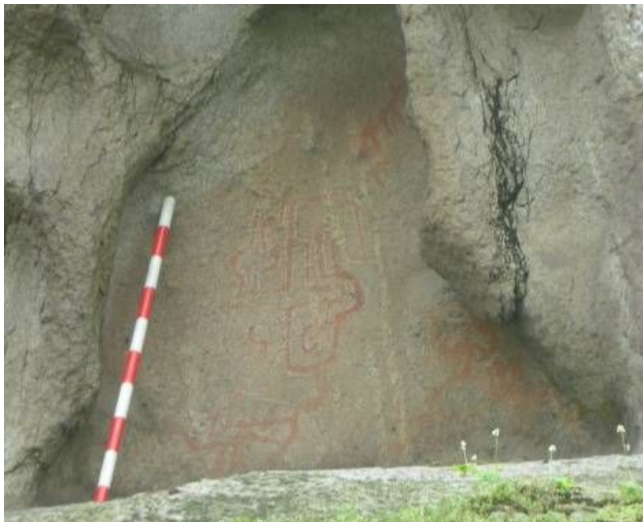
「ペルー・リマ県 チャンカイ谷ロマス・デ・ラチャイ遺跡の岩絵」(2009年10月撮影)